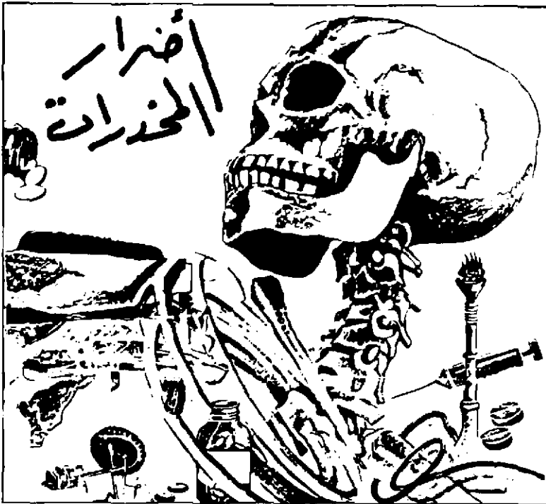
شكل رقم ١ . رسم إرشادي عن أخطار المخدرات على الشباب.

وتتميز الرسوم الإرشادية في تشكيلها بالبساطة والمبالغة أحياناً، والاعتماد على الرموز والجمع بين اللغة اللفظية والأشكال في التعبير عن مضمون الرسالة المقصود توجيهها للجمهور. والرسوم الإرشادية موجهة أساساً لتبصير الجماهير بأشياء ضارة فتحثهم على تجنبها والابتعاد عنها (شكل رقم ١)، أو توجيههم إلى أشياء نافعة مفيدة فتدفعهم إلى الاهتمام بها ومحاولة تطبيقها في الحياة. ١