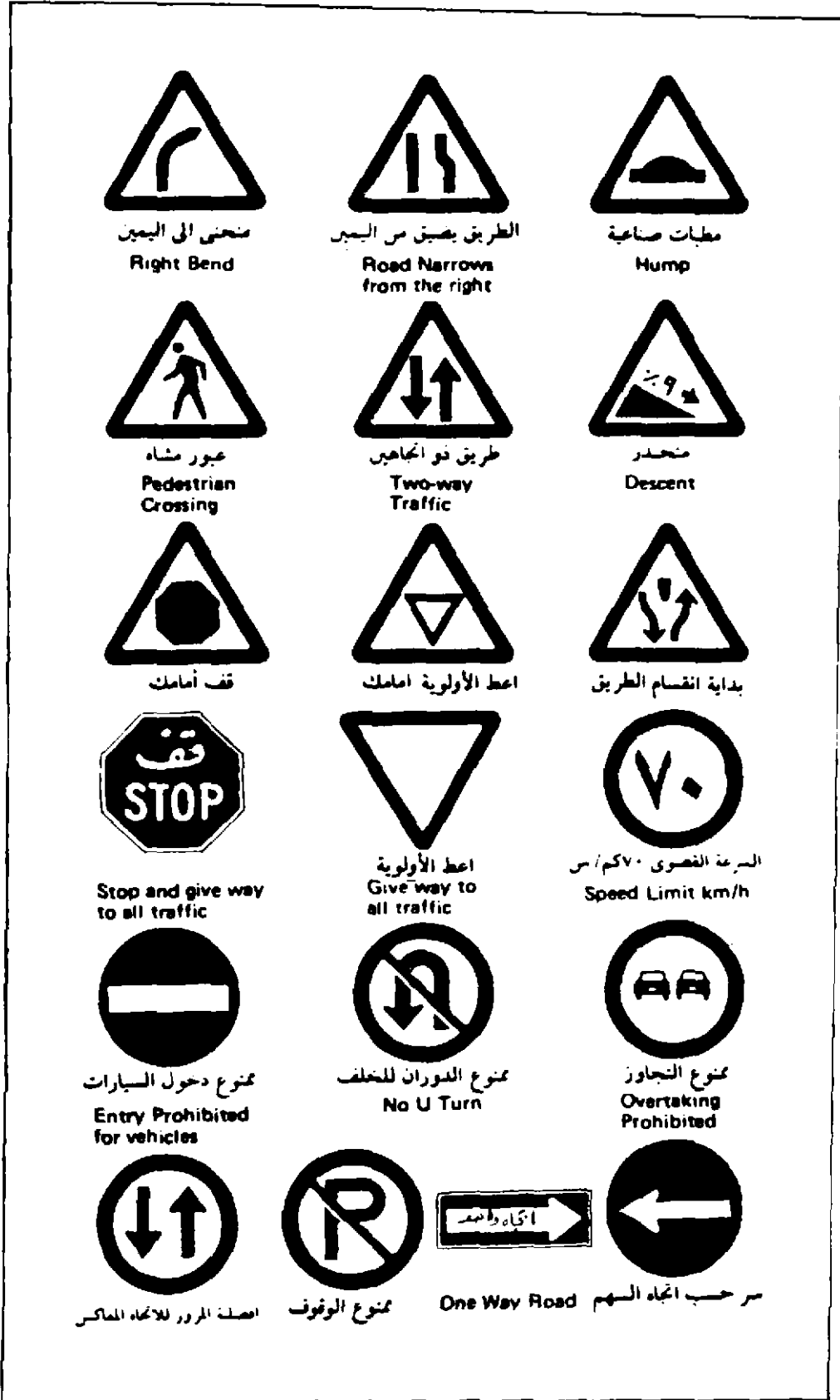
شكل رقم ٥ . رسوم إرشادية مختارة من علامات المرور.