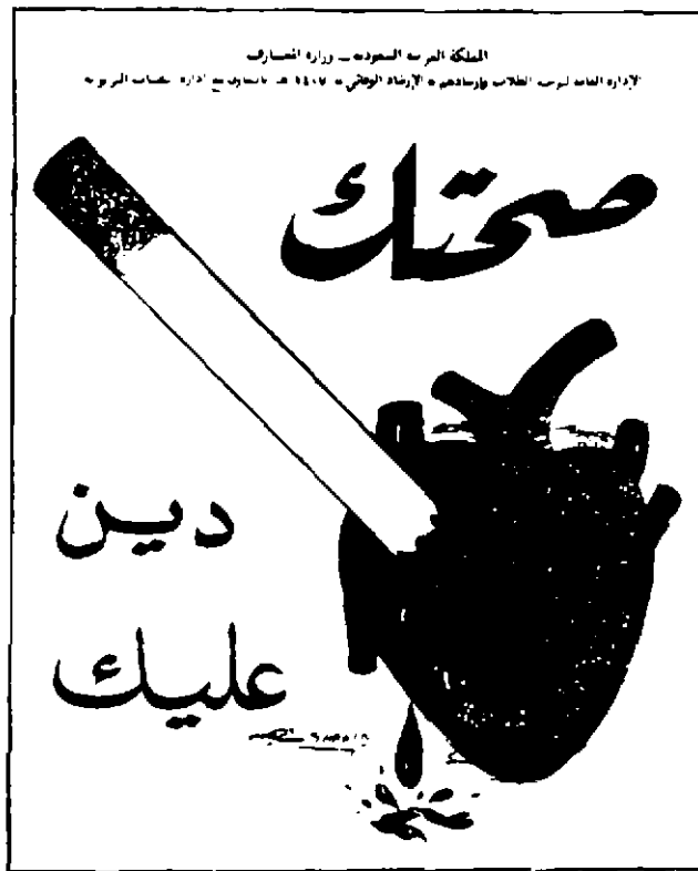
شكل رقم ٣. رسم إرشادي عن مضار التدخين.

إن شرط نجاح عملية الاتصال هو حدوث تأثير في المستقبل ينعكس على سلوكه، ولذلك فيركز علماء التربية على صياغة أهداف التعليم في صورة أهداف سلوكية، وكذلك الحال بالنسبة للرسوم الإرشادية يجب أن تترجم أهدافها إلى إحداث تعديل في سلوك المستقبلين لهذه الرسوم. وليس بالضرورة أن يتم التعديل في السلوك بشكل فوري وسريع، فالمدخن إذا شاهد رسماً إرشادياً عن مضار التدخين (شكل رقم ٣) فليس المتوقع منه أن يسرع بإطفاء سيجارته والإلقاء بها في سلة المهملات وأن يقلع حالا عن عادة التدخين، ٣