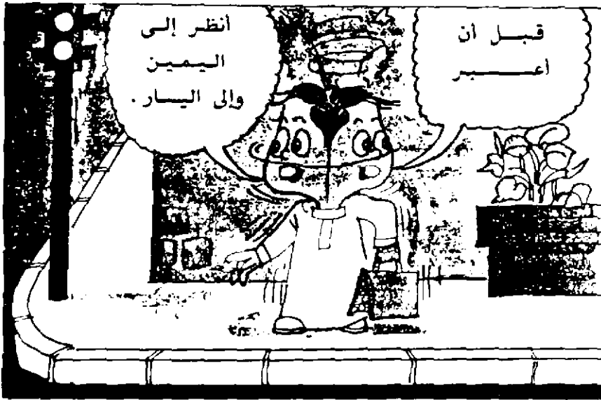
شكل رقم ٢ . رسم إرشادي موجه للأطفال عن أسبوع المرور.

- الكتيبات : وهي عبارة عن صفحات محدودة تناقش بالرسوم واللغة اللفظية معاً موضوعاً إرشادياً معيناً يتناول مناسبة من المناسبات التي يهتم المجتمع بالتركيز عليها مثل ماهو قائم في أسابيع النظافة والمرور (شكل رقم ٢) والمساجد والتدخين والشجرة والتبرع بالدم وغيرها. ٢